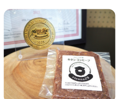
「牛タンコンビーフ(仙台みそ)」 と金賞のメダル