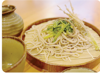
季節限定「せり蕎麦」(1700円) (湯通ししたせりと、根の天ぷらが付きます)

【日時】1月14日(火)19時～ 【内容】「秋保神社神楽」の初奉納(どんと祭18時～21時) 【会場・問】秋保神社(☎022-399-2208) ※情報は都合により変更になる場合があります。