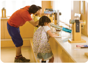
実際に触れて美しい世界を楽しもう