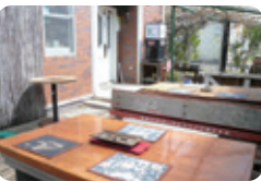
そば処スズメのお宿

「おろしそば+鴨葱汁」や、春限定の「ばっけみそのせご飯」がオススメ! ◎営業時間／11時～20時 (ラストオーダー19時30分) ◎休／水曜日 ◎住所／秋保町湯向25-8 ◎電話／022-397-3151 ◎同伴場所:屋外席(小型犬のみ可) ●ドックカフェではありませんので、リードにつなぐなどのマナーを守ってご利用下さい。