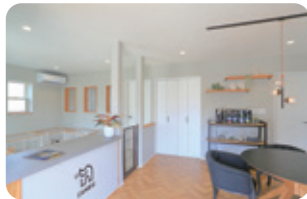
店内の様子。今年の夏頃には、庭にドッグランのスペースを設ける予定。