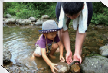
秋保フィッシングエリア「つかみ取り」

美しい山間にある、ルアーとフライ専門の釣り場。5月からは、隣接する沢でニジマスのつかみ取りを楽しめる季節になります。大人でも子どもでも、何人で行ってもOK!つかみ取りした魚は、焼いて食べることができます(バーベキューは別料金)。ビーチサンダルなど濡れてもいい靴でお越しください。5尾2,500円(追加1尾500円)から。要予約。 住所／秋保町長袋字山崎40 ☎022-399-2191 営／7時～日没 年中無休