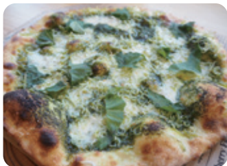
「青じそとしらすのピザ」980円 URL https://pizza-tasuda.com/

また、このお店のもうひとつの魅力は、店内から眺める雄大な景色。立田さんは、お客様に最大限楽しんでもらえるよう、窓を大きくし、席に