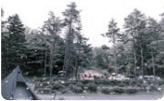
申込み・問い合わせ先 秋保森林スポーツ公園 (☎022-398-2345)