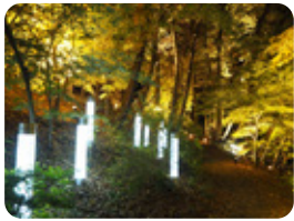
秋保・里センター「磊々峡もみじのこみちライトアップ」

イルミネーションを撮影したり、おいしい食事に舌鼓を打ちながら作品を鑑賞したり、さまざまな楽しみ方ができるイベントです。秋の夜長は「アキウルミナ」でどうぞ！ゆくりとお過ごしください。