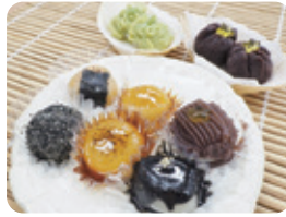
【価格】つんだ・つぶあん(2粒で150円)、ごま・みたらし・こしあん・ごまあん(よりどり3粒で140円)