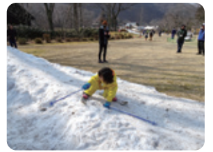
昨年のソリ滑りの様子