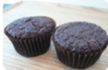
「焼きしょこら」(155円/1個) ミニサイズでもずっしり濃厚