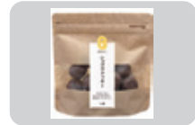
「ショクラクッキー」(600円/1袋) HACHIのコーヒーに合う ザクザククッキー

旬情報 秋保のおすすめチョコスイーツ♡ 今回はバレンタインデーにぴったりの チョコレートを使ったお菓子をご紹介いたします。