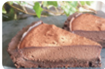
「生チョコタルト」(699円) 卵・乳製品・白砂糖不使用の 人気No.1タルト