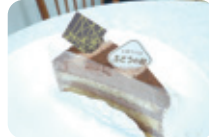
「生チョコ」(300円) 昭和57年創業のケーキ屋さん 作るやさしい味