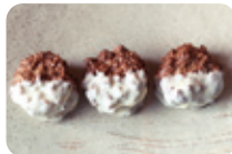
「自家製雑穀グラノーラクッキー ～クワールチュールホワイトチョコレートかけ～」 (432円/3個入り) 農業不使用のきび・あわひえ入りの さくさく食感クッキー