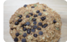
「アンザッククッキー」(200円) オーツ麦、チョコチップなどが 入ったビッグサイズのクッキー

金額はすべて税込込み。 お持ち帰り用の価格です。 店舗の詳細は裏面をご覧ください。