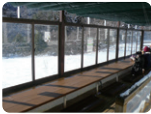
【茶っぼりんの利用時間】 12～2月は10時～15時30分。 通常は16時まで。

できます。ご利用は無料。収容人数40名(2021年1月現在は20名で対応)。 【住所】太白区茂庭字中谷地南32-1 【電話】022(302)6081