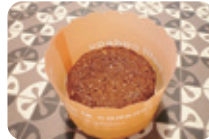
「ガトーショコラ」(300円) チョコレートの旨みが詰まった 濃厚な味わい