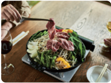
山カジンギスカン 一人前 1,700円 (生ラム150g・季節の野菜盛り/税別)

「山の景色を見ながら力が入るようなご飯を食べてもらいたい」。そんな思いを込めて10月にオープンした「ジンギスカン山カ」があるのは天守閣自然公園の敷地内。天井が高く、木の温もりが感じられる店内では、移ろう景色と共に美味しいジンギスカン料理を楽しめます。