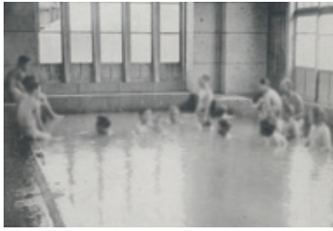
秋保温泉クラブ大プール (昭和7年/1932開業)