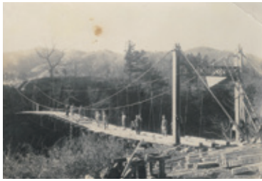
建設中の初代「湯の橋」