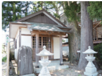
なとりのみゆひ ゆがみしゃ 名取御湯碑と湯神社