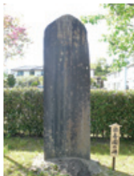
らくじゅえん 楽寿園の碑