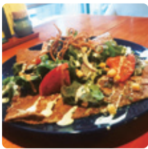
そば粉のクレープ「ガレット」 美味しいコーヒーと一緒にどうぞ

◆SOBA to GALETTE あずみの 〔定休日〕火曜日・第一三水曜日 〔営業時間〕11時～17時 〔電話〕022(398)6253 〔住所〕秋保町湯元字枇杷原1-2