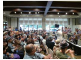
問合せ:秋保温泉MUSIC BAR2019 事務局(篝火の湯 緑水亭内) ☎022-397-3333

毎回、様々なジャンルの音楽を飲食とともに楽しむことができる好評の「MUSIC BAR」では、出演ミュージシャンによる