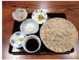
辛味大根ざる 1,026円(税込)

◆手打ち蕎麦 二代目たまき庵 【営業時間】11時～15時 【土日祝は10時30分～15時30分】木曜休 【電話】022(399)2120 【住所】秋保町馬場字大滝8-1