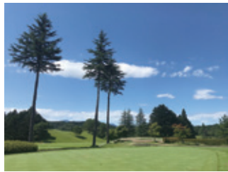
【プレー料金】平日¥6,500～ 土日祝¥10,000～ GW¥8,000～

◆太白カントリークラブ 秋保コース 電話 022(397)3211 住所 秋保町湯元字太夫134