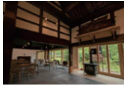
イベントなどの詳細はアキウ舎のウェブサイト、またはお電話で。

「昔から訪れていた秋保に、地域内外の人々が集う場を作りたかったんです。」 「アキウ舎」 ◆アキウ舎 「休業曜日(12月30日～1月3日) 【営業時間】11時～17時 17時以降は10名以上の事前予約で貸切 【電話】022(724)7767 【住所】秋保町湯元字除9-14