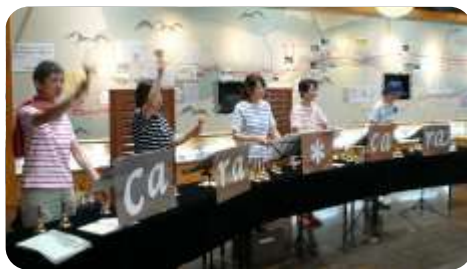
12月15日(土) ミュージックベルグループ cara * cara (ミュージックベルの演奏)