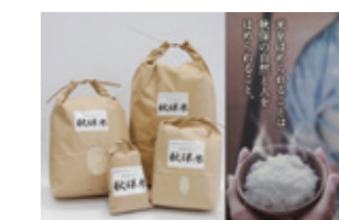
環境保全米「清流育ち秋保米」 https://www.jasendai.or.jp/akiu/akiu_mai_kome.html

「交流や地域づくりを軸とした開かれた米作り」をしている団体を、3年に1度表彰しているのがオリザ賞です。