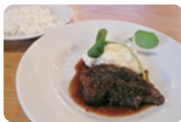
豚肩ロースのビール煮(¥890) (ライス別料金)

秋保・里センターの足湯「寿右エ門の湯」およびレンタサイクルは、12月~3月の期間中はお休みします。