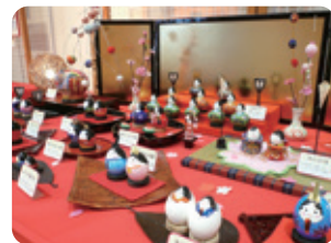
（開催期間）2月9日(土)~3月21日(木・祝)