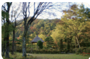
ゆっくりと散策を楽しめる仙台市秋保大滝植物園

温泉街に近い「天守閣自然公園」は、秋保石の石組と池を中心に構成された池泉回遊式庭園として知られていますが、秋には園内にある約500本のモミ