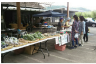
「さかいの産直市」土日のみ開催/9~15時(今年は10月21日(日)まで)

補助事業の項目は、①産直市場の設置(交流拠点) ②里山環境整備 ③散策・探訪コースの整備 ④地域資源の活用。①にあたる「さかいの産直市」は、県道62号線沿いのJA倉庫前にて好評開