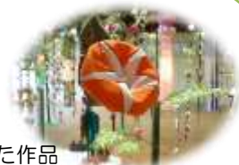
古布で作られた作品