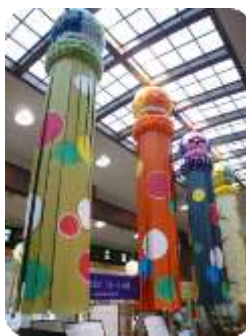
仙台七夕名物の 大きな吹流し