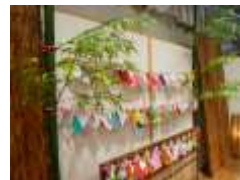
願い事を書く コーナー