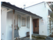
入り口には、パンの焼きあがり時間が書かれた黒板があります。

住宅街の角に佇む白壁のベーカリー「森の貝殻」。お隣のピザ店「ドットレ」の姉妹店として6月にオープンしました。「無口なあんばん」や「王妃の食パン」など、ユニークな名前の商品が並ぶ話題のお店です。