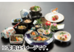
※写真はイメージです。 秋保温泉旅館組合 http://akiuonsenkumiai.com/

秋保温泉旅館組合に加盟する施設の各料理長で構成している「森のダイニング」が企画した「森の温泉冬ランチ」が開催されます。今年で8回目となるこの企画は、「清流育ち秋保米」と「秋保福おみそ」、宮城東