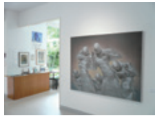
中庭からの光が降り注ぐ館内