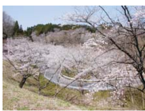
約80本の桜並木は見事です!

日時／4月26日(土)10時～13時30分 参加費／無料 定員／10名 申込／4月14日(月)10時から電話受付 会場・問／秋保ビジターセンター ☎022-399-2324