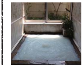
写真もやの湯(牛乳風呂) 旅館山菜荘 電話022-398-2646