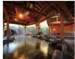
写真:潮滝の湯・大和 泉質:ナトリウム・カルシウム・塩化物泉 ホテル瑞鳳 電話022-397-1111

広く明るい内湯に浸かった後は、お目当ての露天風呂へ。水深130cmもある立ち湯は、秋保でも珍しいお風呂で、身体にかかる適度な圧力が心地いいです。 そしてとなりの「潮滝の湯・大和」では、打瀬湯を堪能。流れ落ちるお湯が、肩や背中をマッサージ。つつい長湯になってしまいました。