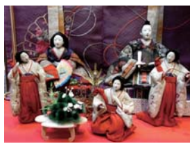
明治時代の雛人形

*「傘福」山形県酒田地方で作られるつるし飾りの一種 (詳細は「かわらばん」裏面か、専用チラシをご覧ください)