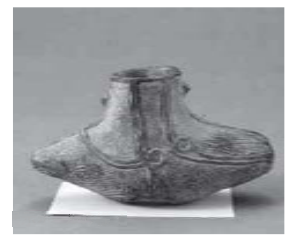
皮袋形土器

みなさんは、里センター館内の「秋保ふるさと生活ギャラリー」をご存知でしょうか。ここは仙台市が所有する、秋保地区に残されてきた考古資料や民俗資料を紹介したコーナーです。この中の展示物の一つ、「皮袋形土器」(約4500年前縄文土器/仙台市指定有形文化財)が、現在、仙台市縄文の森広場(太白区山田上ノ台町)で開催中の「縄文人のなりわい」仙台の遺跡からのメッセージ」に9月25日(日)まで展示されています。形が珍しく、上ノ原遺跡(長袋から発見された貴重な資料です。ぜひ他の遺跡から見つ