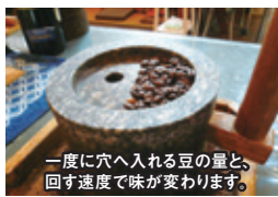
一度に穴へ入れる豆の量と、回す速度で味が変わります。 料金(税込)/500円(2杯分) *一度に4名まで体験可能です。

秋保の家の「石臼挽き珈琲」 「秋保菓の家」で至福のコーヒータイムはいかが？ テーブルに用意された石臼の穴に珈琲豆を入れて回す。シンプルな体験ですが、挽き立てのコーヒーの香り、そしてプチプチと豆を挽く感触が何とも言えません。