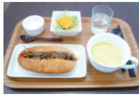
ランチセット一例 (ポタージュセット+きんぴらごぼろサンド)