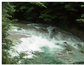
優雅な流れの「すだれ滝」