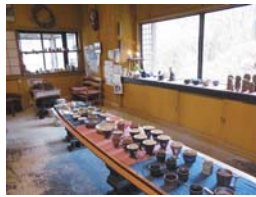
「ギャラリー石神窯」