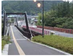
左側が「湯の橋歩道橋」 右側が車専用道路「湯の橋」

日時/11月16日(土)10時~14時 対象/4歳以上の親子20名 申込/11/7(木)10時から電話受付 会場・問/秋保ビジターセンター(☎022-399-2324)