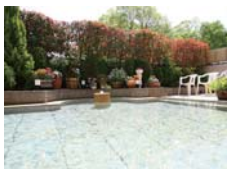
庭苑野天風呂「明鏡の湯」 泉質：ナトリウム・カルシウム・塩化物泉 蘭亭 電話022-397-1515

今回は、女性・フアミリーに優しいと評判の宿、蘭亭を訪れました！ 壁面に蘭の花のモチーフがあしらわれた大浴場「蘭の湯」と、そこから続く庭苑野天風呂「明鏡の湯」は、ほどよい温度の湯が浴槽いっぱい満たされ、ついつい長湯したくなる心地よさ。刺激が欲しい方にはジェットバスもおすすすめです。 浴場内にはシャワーキャップや子供用のおもちゃ、座りやすい背もたれ付イスが用意されており、小さなお子様からご年配の方まで安心して入浴できます。さらに女性用脱衣所には、スキンケア用品のほかマニキュア等