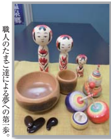
職人のたまご達による夢への第歩。

未来の希望が集結！「秋保工芸の里」 「秋保工芸の里」に新しい風が舞い込んできた。伝統工芸職人を目指す若手が、こけしや仙台筆筒など5つの工房へ弟子入りを希望。11月からそれぞれの職人のもと、その技術を基礎から学んでいる。国の雇用創出事業を活用しての入門だが、彼らの熱意は工芸の里全体に活気を生み出している。 まだスタートを切ったばかり。だが、彼らもつなぐ鮮やかなアイデアや感性、そして今後の新しい取り組みに期待が膨らむ。