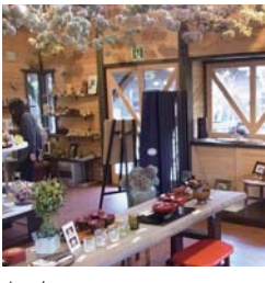
木の家 http://www.akiu.net/kinoie ☎022-397-2714